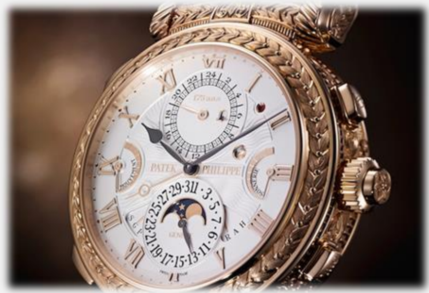
Najdroższy zegarek świata: Patek Philippe Grandmaster Chime