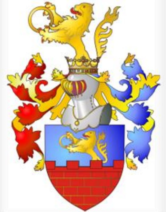
Prawdzic (herb szlachecki)

3 października 1831 został odznaczony Krzyżem Złotym Orderu Virtuti Militari.