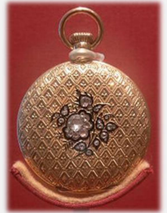
Ekskluzywny zegarek firmy Patek Philippe & Co

Sukcesy swe firma Patek Philippe uzyskiwała dzięki przestrzeganiu następujących zasad Antoniego Patka: jakość produkowanych zegarków musi być utrzymywana na najwyższym możliwym do osiągnięcia poziomie; trzeba umieć wprowadzać nowe wynalazki i rozwiązania konstrukcyjne, które pozwolą uzyskać przewagę techniczną nad konkurencją.