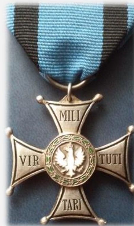
Order Virtuti Militari

3 października 1831 został odznaczony Krzyżem Złotym Orderu Virtuti Militari.