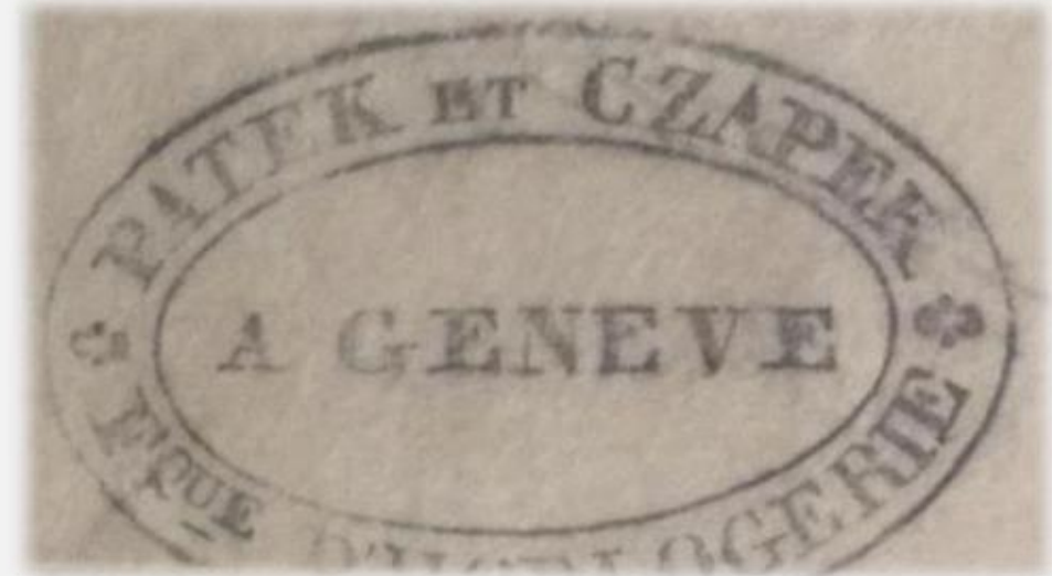
Pieczęć firmy Patek Czapek

W rozrastającej się firmie Patek Czapek zatrudniano polskich zegarmistrzów przybywających głównie z Królestwa Polskiego.