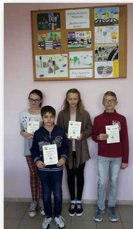
Laureaci Szkolnego Konkursu Plastycznego „Bezpiecznie na drodze”